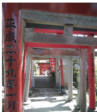
空鉢護法堂への登り