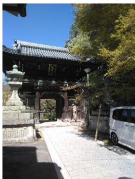
駅から真っすぐな道

コロナが少し収まれば、親しい友達と山歩きをお楽しみ下さい。誰でも登れる安全な山の紹介です。今回は、信貴山です。一度は、行っておられると思いますが、表ケーブルを撤去した後の信貴山です。また、信貴山の「朝護孫子寺」から、さらに上にある「空鉢護法堂(信貴山縁起絵巻に描かれている、法力で空鉢を長者屋敷に飛ばし、米蔵を乗せて空に飛ばす物語)」までの山登りです。JR 王寺駅から近鉄で1 駅、信貴山下駅で下車します。駅前のケーブル跡がそのまま真っ直ぐな車道になっています。その横に細い道が並行してあり、これを登ります。中程で右に少し折れ、また、真っ直ぐな山道となりケーブル山上駅まで続きます。山上駅からは、昔のままの参道を登ります。巨大な虎が迎えてくれます。朝護孫子寺にお参りしてから、さらに上に登って行くとジグザグの赤い鳥居が並んだ「空鉢護法堂」へ続く道になります。お堂の標高は 430m です。スタートは標高 60m 程度だから 370m の山登りになります。お堂からの景色は非常に良いです、なお、本数は少ないですが (1 時間に 1 本程度)、信貴山下駅からケーブル山上駅までバスもあります。